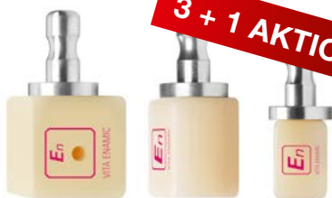
VITA ENAMIC®, VITA

Monochromatische Hybridkeramik-Rohlinge. Besonders für ästhetische Rekonstruktionen bei limitiertem Platzangebot.