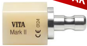
VITABLOCS® Mark II, VITA

Monochromatische, zahnfarbene Feldspatkeramik-Rohlinge. Exzellent geeignet zur Fertigung kleinerer, ästhetischer Rekonstruktionen wie Inlays, Onlays und Teilkronen.