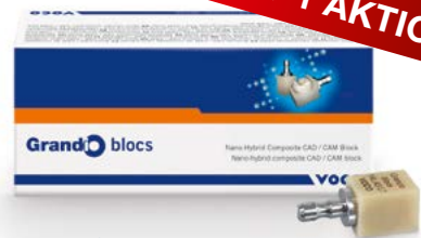
Grandio® blocs, VOCO

Grandio® blocs ist ein nanokeramischer Hybrid CAD/CAM Block zur Fertigung permanenter Einzelzahnrestaurationen.