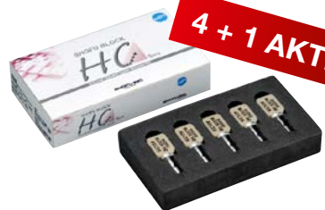
SHOFU® HC Blocks, SHOFU

SHOFU Block HC ist für nahezu alle Einzelzahnindikationen der CAD / CAM- Technik einsetzbar und in diversen Farbtönen (hoch- und niedrig transluzent) als jeweils ein- und zweischichtiger Fräsblock erhältlich.