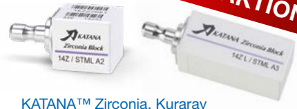
KATANA™ Zirconia, Kuraray

Der MULTI LAYERED KATANA™ Zirconia Block ist aus vier Zirkon-Schichten und einem integrierten Farb- und Transluzenzverlauf aufgebaut. Die hohe Biegefestigkeit von 763 MPa und die hohe Transluzenz bei minimalinvasiver Präparation führen zu einer außergewöhnlichen Ästhetik.