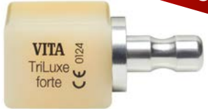
VITABLOCS® TriLuxe forte, VITA

Multichromatische Feldspatkeramik-Rohlinge mit vier Farbintensitätsschichten. Für hochästhetische Rekonstruktionen wie FZ-Kronen, Veneers, Teil- und Vollkronen.