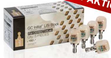
Initial LiSi Block, GC

CAD/CAM-Block aus Lithium-Disilikat für Chairside-Lösungen. Initial LiSi Block ist ein vollständig kristallisierter Lithium-Disilikat-Block, der ohne Brennvorgang über optimale physikalische und ästhetische Eigenschaften verfügt.