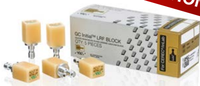
Initial™ LRF, GC

CAD/CAM-Block aus leuzitverstärktem Feldspat in fünf V-Farbtönen mit hoher und geringer Transluzenz für vollanatomische, indirekte Einzelzahnrestaurationen aus Vollkeramik.