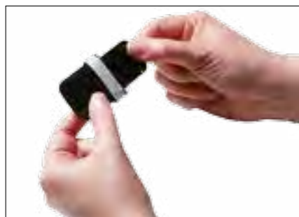
So flexibel wie ein Film – für hohen Patientenkomfort.

Der KaVo Scan eXam™ One liefert klare und scharfe Bildergebnisse mit akkurat dargestellten Graustufen. Die erforderlichen diagnostischen Informationen werden bis ins kleinste Detail abgebildet.