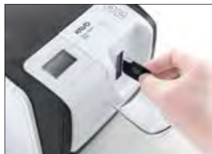
Einfache Bedienung von der Frontseite – sehr platzsparend.