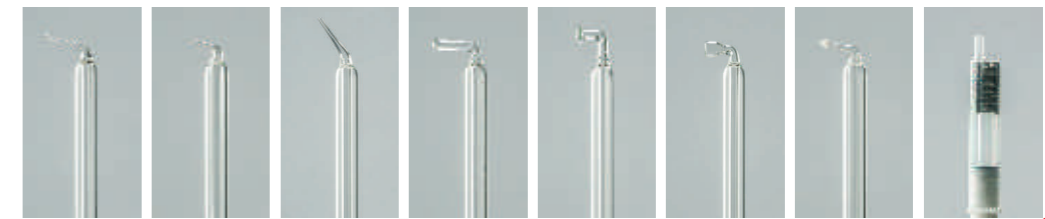
PS00 PS02 PS04 PS08 PS12 PS14 PS16 PSKP